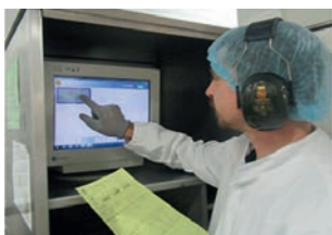
Jimmy Fromagerie Bel

Construction de vérandas Agent de fabrication